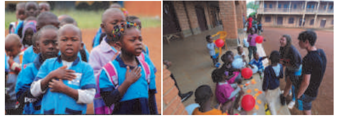
Cameroun: rentrée scolaire à l'école Raïssa de Romain & Francky

La satisfaction des résultats obtenus par les enfants dans tous ces projets sont « des bouffées d'oxygène » dans le contexte sanitaire un peu morose.